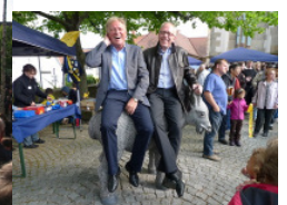
Jahreshauptversammlung März 2011